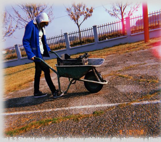
imi 6.2 Shtetet në fëmijë... për të siguruar mbijetesën dhe zhvillimin e fëmijë